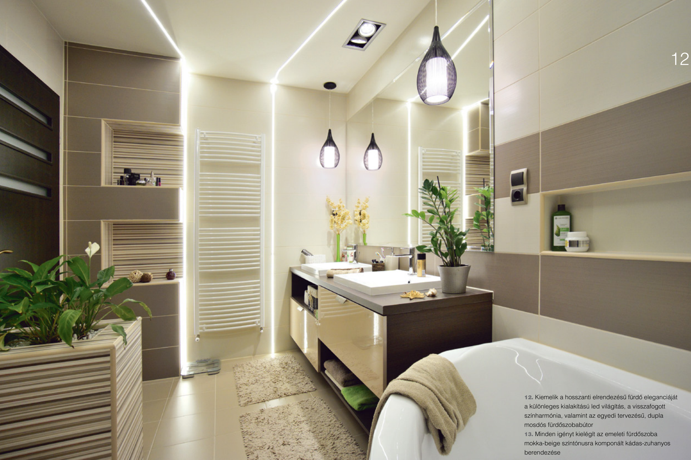
12. Kiemelik a hosszanti elrendezésű fürdő eleganciáját a különleges kialakítású led világítás, a visszafogott színharmónia, valamint az egyedi tervezésű, dupla mosdós fürdőszobabútor 13. Minden igényt kielégít az emeleti fürdőszoba mokka-beige színtónusra komponált kádas-zuhanyos berendezése