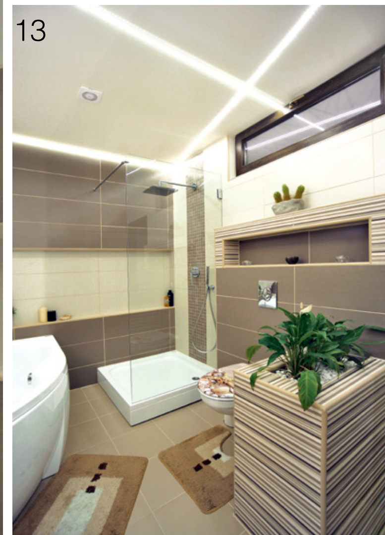
Padlóburkolatok, csempék, szaniterek – Aquarius Fürdőszobaszalon Budapest Aquarius Otthon Kft., 1112 Budapest Dió utca 7., tel.: 308-7853, mobil: 20/394-6770, www.csempebuda.hu

lépcsőház világosszürke, ami az emeleti közlekedőben vált át lilásszürkére. A fürdőszobában és a hálószobában szintén a beige-mokka színek az uralkodóak. A nappaliban és a hálószobában a barnák és finom beige-ek kontrasztját szépen kiegészítik a textilekben lévő kékes árnyalatok. Az elegáns, kiváló minőségű szaniterekkel felszerelt, időtálló burkolatú fürdőszobában a funkcionalitás hangsúlyozottan érvényesül.